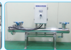
자외선 살균장치 (U.V Sterilizer System)