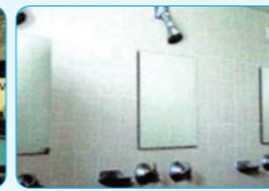
사위시설 헬스클럽, 스포츠 센터, 수영장 등