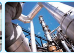
산업시설 일정 이상의 수질이 필요한 생산시설