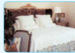
숙박시설 호텔, 레저텔, 여관, 모텔 등