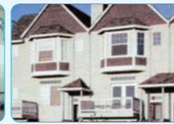
주거시설 전원주택 단지, 다세대 주택, 원룸 등