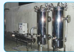
정밀여과장치 (Micro Filter System)