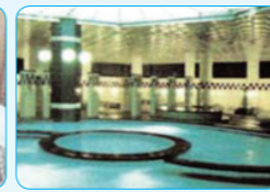
목욕시설 사우나, 찜질방 등