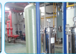
활성탄 여과장치 (A/Carbon Filter System)