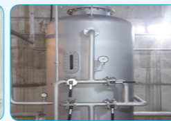
다층 여과장치 (Multi Filter System)