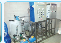
수영장 여과장치 (Swimming Pool System)